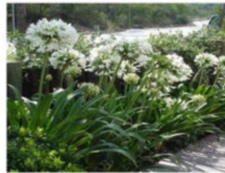
Agapantos/ Agapantus Africanus