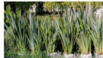
Fornio/ Phormium tenax