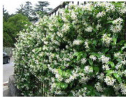
Jazmín de arabia