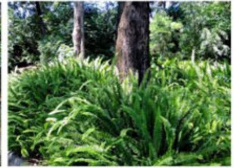
Helcho peine/ Nephrolepis cordifolia