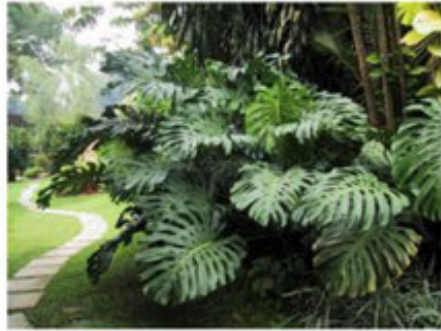
Monstera/ Monstera deliciosa